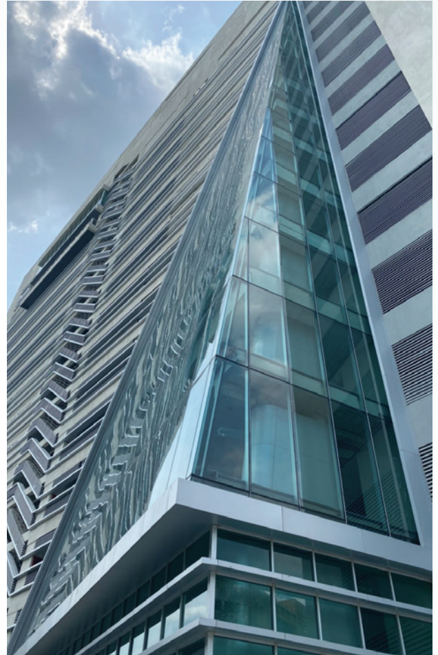
มหาวิทยาลัยเกษตรศาสตร์ วิทยาเขตศรีราชา