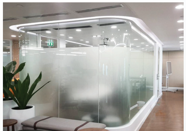
สำนักงาน SCB Abacus