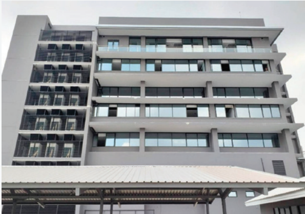
ศรีไทยมาร์เก็ตติ้ง