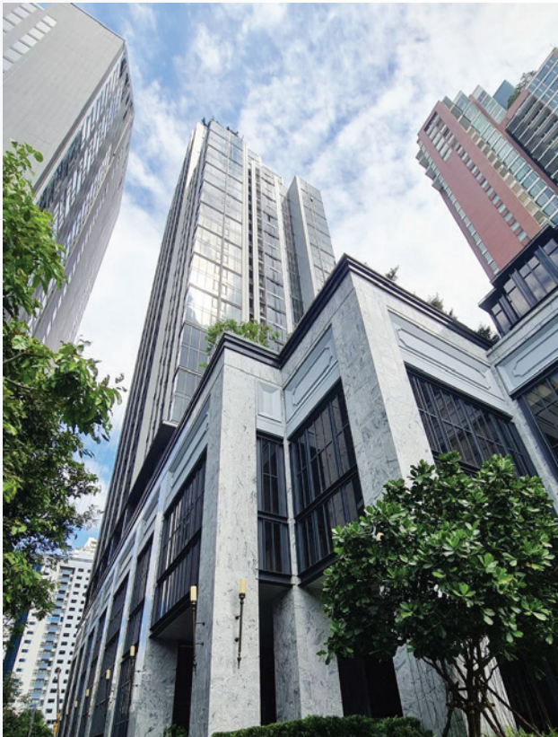
HYDE Heritage ทองหล่อ